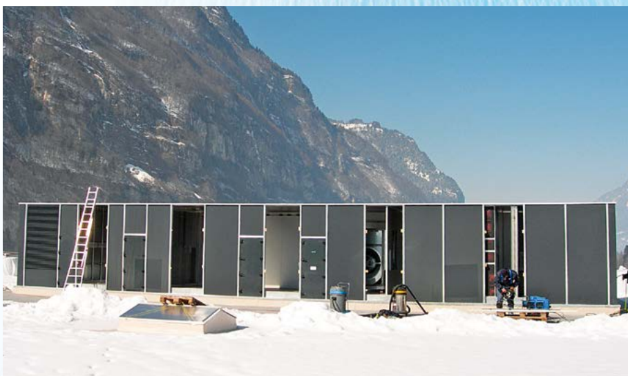
Sauter Bachmann, Netstal

Mountair AG Lufttechnischer Apparatebau Sonnenwiesenstrasse 14 CH-8280 Kreuzlingen