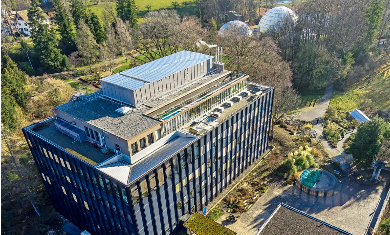
Botanischer Garten, Zürich