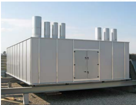
VHF Flexcell, Yverdon