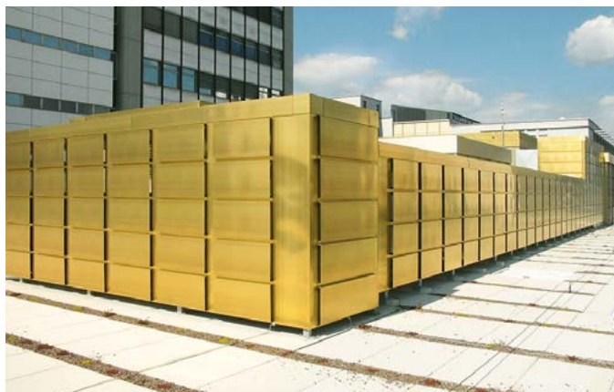
Novartis Campus, Märkli Building